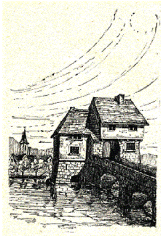
La prison ou Bunyan écrivit : « Le voyage du Pèlerin » « La Cité de l'Âme », etc...

Emmanuel chassa ensuite Diabolus. L'heure n'était pas encore sonnée qui devait le voir jeter dans l'Abîme ; et il lui ordonna expressément de ne plus jamais s'emparer de la Ville de l'Âme.